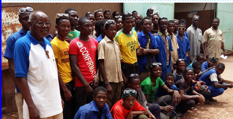
Formando a niños y jóvenes desescolarizados