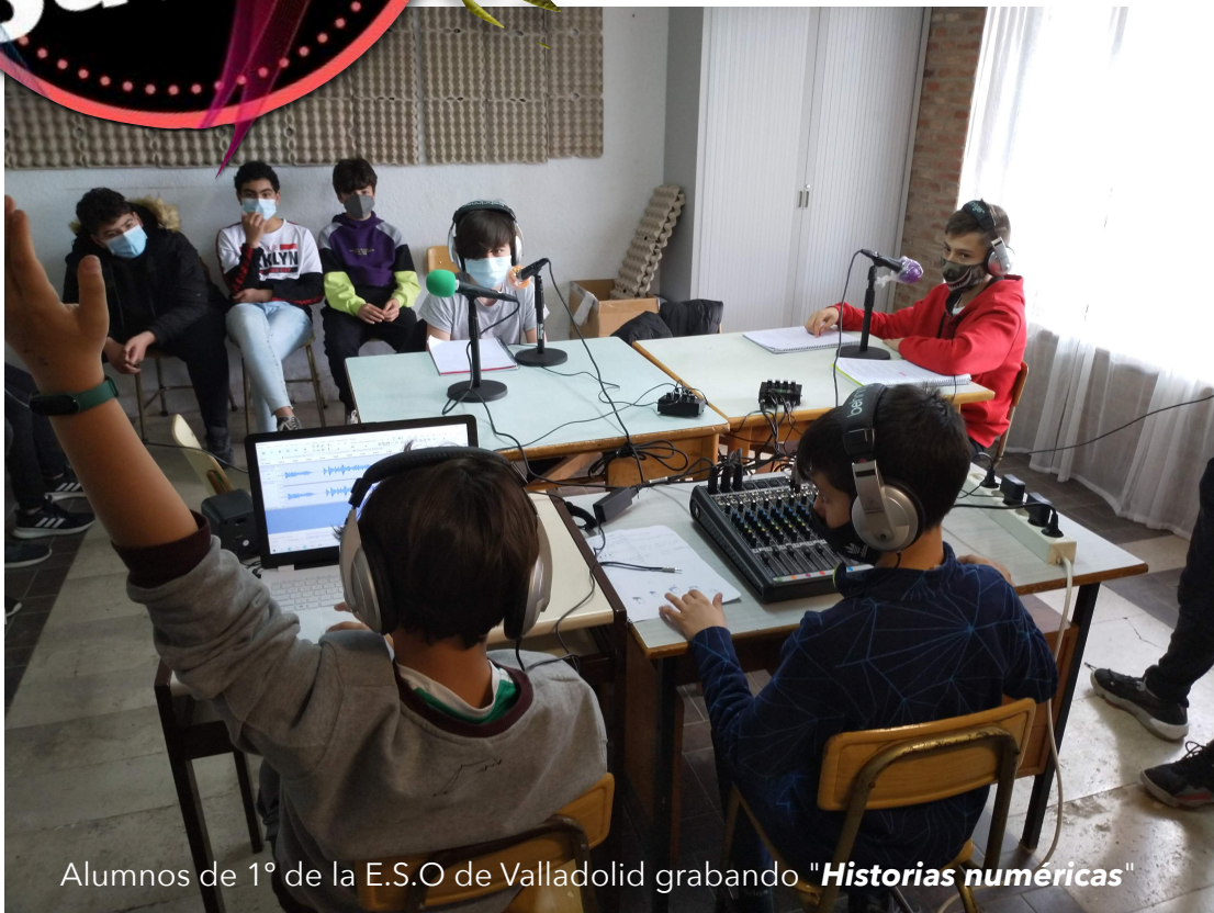
Alumnos de 1º de la E.S.O de Valladolid grabando " Historias numéricas "